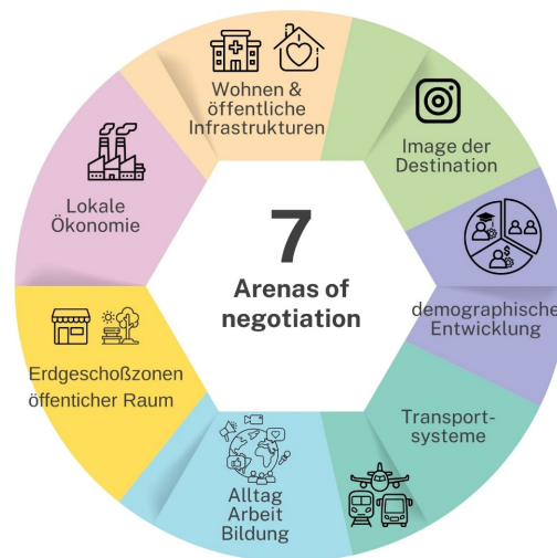
Abbildung 1: Arenen der Ausverhandlung in der Tourismusentwicklung. Grafik: Cornelia Dlabaja

Diese Neuordnung hat Auswirkungen auf die Zusammensetzung der lokalen Wirtschaft und führt in Städten wie Venedig oder Lissabon in Teilen der Stadt zu einer wirtschaftlichen Monokultur (Van da Borg, 1997; Russo, 2002), die sich auf das Alltagsleben ihrer Bewohnerinnen und Bewohner negativ auswirkt. Das Ergebnis sind überfüllte öffentliche Räume in der Hochsaison, die als Kulisse für Fotos dienen (D'Erasmus, 2017), die über soziale Medien verbreitet werden. Gleichzeitig entsteht eine Tourismuswirtschaft, die sich nicht an den Bedürfnissen der lokalen Bevölkerung orientiert, sodass Souvenirläden und Restaurants Geschäfte für Waren des täglichen Bedarfs ersetzen (Urry, 2002). Der Wohnungsmarkt wird durch Kurzzeitvermietungen verändert, was die Einwohnerzahl senkt. Familien ziehen aus den touristischen Stadtvierteln weg und Schulen schließen (Dlabaja, 2026; Russo, 2002). Dies wirkt sich negativ auf die demografische Struktur der Nachbarschaften aus. Diese Entwicklung wird in Städten wie Venedig, Hallstatt oder Salzburg durch die Imageproduktion in Filmen, Serien und sozialen Medien verstärkt (Urry, 2002). Zusätzlich beeinflussen touristische Mobilitätsinfrastrukturen, wie Häfen, (Bus)Bahnhöfe und Flughäfen die Touristenströme.