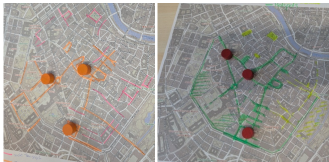
Abbildung 6: Kartierung der Vorder- und Hinterbühnen der Inneren Stadt.