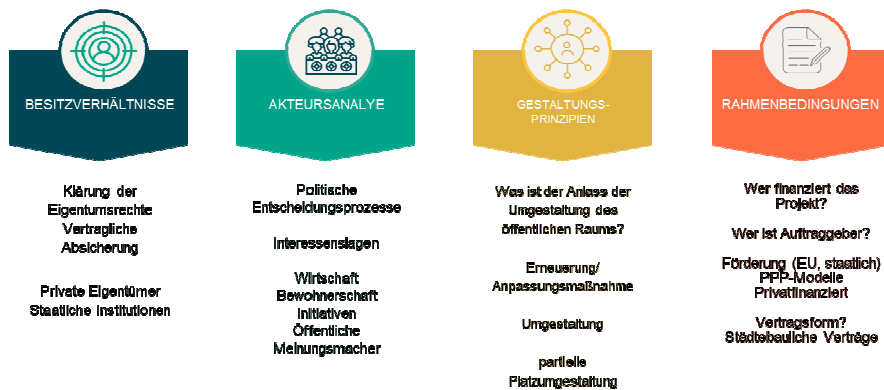
Abbildung 5: Ankerpunkte für die Planung. Grafik: Cornelia Dlabaja

Entscheidungsträgerinnen und Entscheidungsträger. Es bedarf klarer Rahmenbedingungen, um die finanziellen Mittel abzusichern und abzuklären, wer für die Kosten aufkommt, sowie die Freigabe der notwendigen Mittel veranlassen kann.