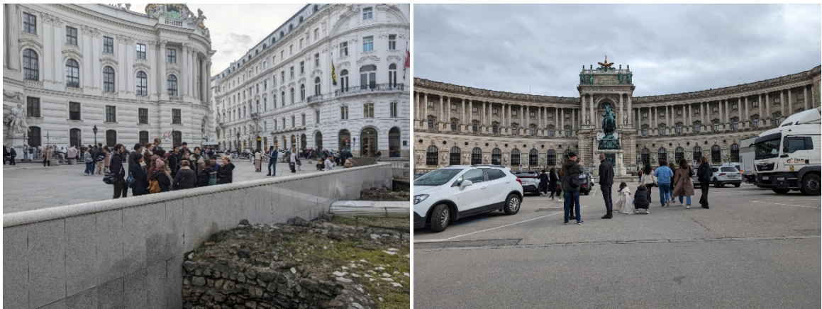
Abbildung 4: Michaelerplatz und Heldenplatz

Der Michaelerplatz liegt im Herzen des ersten Bezirks. Er ist einer der Hotspots, was touristische Bewegungsströme betrifft. Wesentliche Ansprüche der rezenten Umgestaltung 2024 waren Gendermainstreaming und Barrierefreiheit, sowie Aspekte der Klimaanpassung. Durch Baumpflanzungen und kühlender Gestaltungselemente sollte der Stadtraum klimaresilient gestaltet werden. Zusätzlich zur abgeschlossenen baulichen Neugestaltung bedarf es Überlegungen zur Entzerrung der Besucherströme sowie zur nachhaltigen Nutzung des Orts für die lokale Nachbarschaft und seine Unternehmerinnen und Unternehmer. Im Analysezeitraum kam das Thema des Welterbes und die kontroverse öffentliche Debatte hinzu. Proteste im Kontext von Stadtentwicklung und die Rolle von Protestbewegungen als Raumproduzentinnen und Raumproduzenten haben in Wien seit den 1970er-Jahren lange Tradition (Dlabaja, 2025).